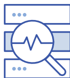
Audits et conformité réglementaire